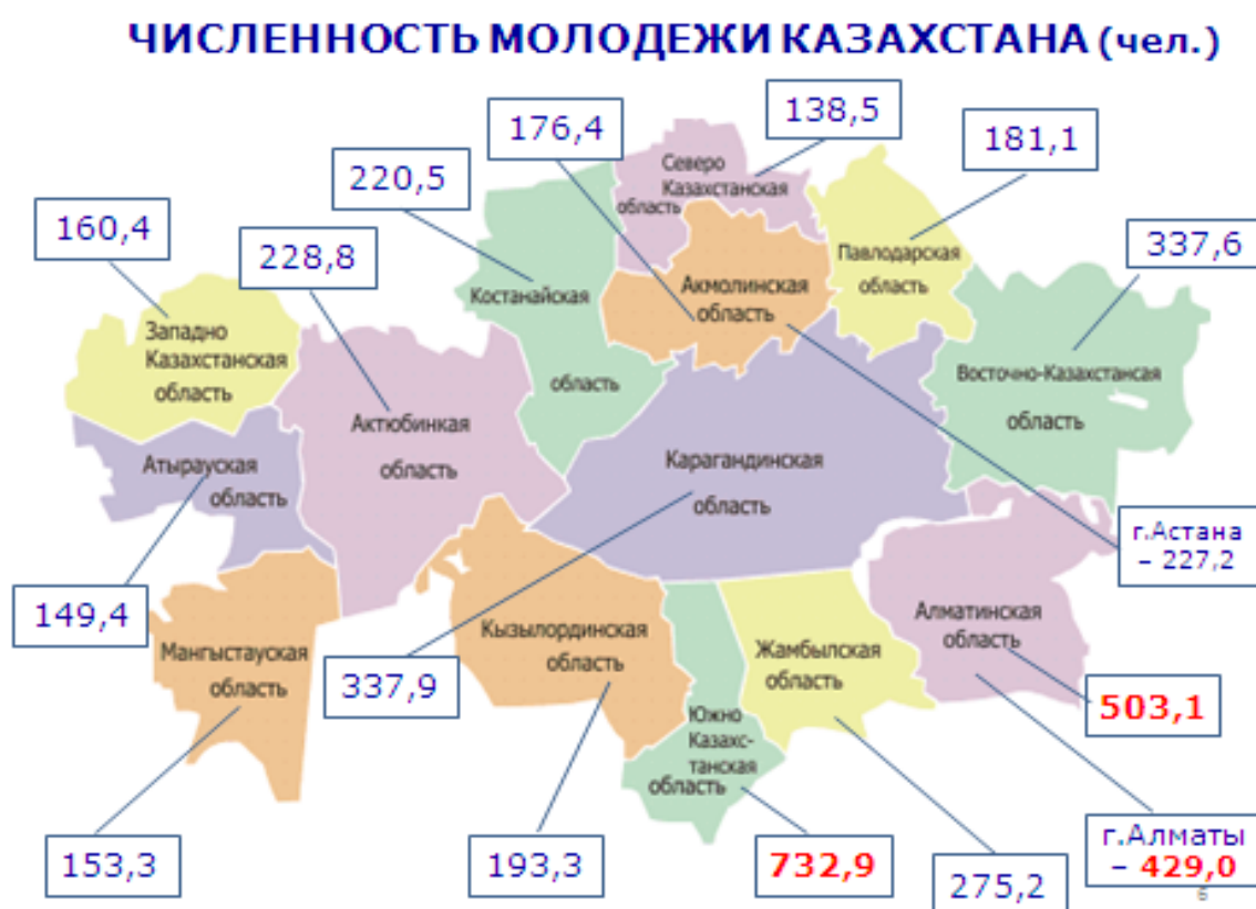
Рисунок 1. Численность молодежи Казахстана (на начало 2012 года)

В региональном сопоставлении наибольшая доля молодежи приходится на Южно-Казахстанскую, Алматинскую, Восточно-Казахстанскую, Карагандинскую области и город Алматы.